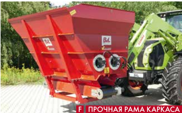
Ф ПРОЧНАЯ РАМА КАРКАСА

Используя разбрасыватель V-COMFORT Bedding в версии MAX, Вы можете легко подготовить в своем животноводческом помещении самые разнообразные варианты подстилки. Регулируемый объем дозирования и разное расстояние выброса позволяют оптимально распределять