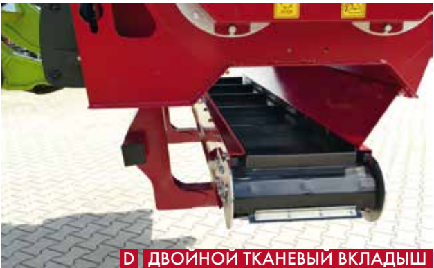
Д ДВОЙНОЙ ТКАНЕВЫЙ ВКЛАДЫШ