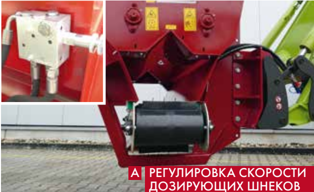
А РЕГУЛИРОВКА СКОРОСТИ ДОЗИРУЮЩИХ ШНЕКОВ