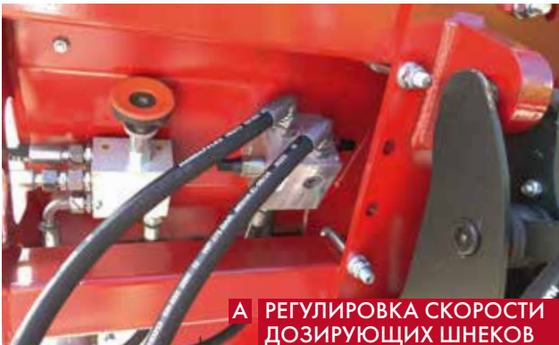
А РЕГУЛИРОВКА СКОРОСТИ ДОЗИРУЮЩИХ ШНЕКОВ