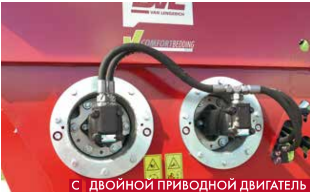
С ДВОЙНОЙ ПРИВОДНОЙ ДВИГАТЕЛЬ