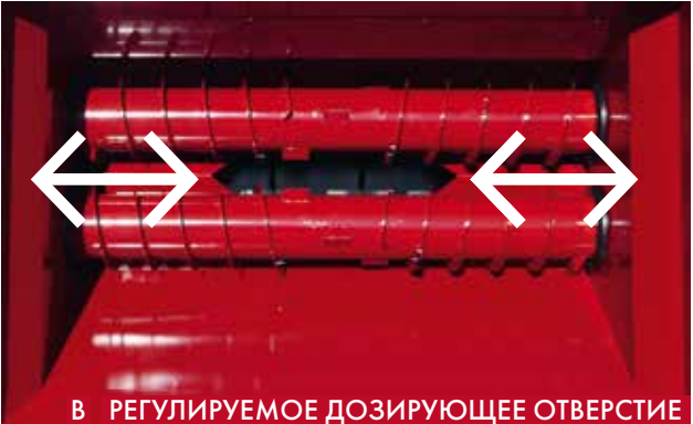
В РЕГУЛИРУЕМОЕ ДОЗИРУЮЩЕЕ ОТВЕРСТИЕ