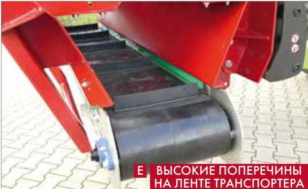
Е ВЫСОКИЕ ПОПЕРЕЧИНЫ НА ЛЕНТЕ ТРАНСПОРТЕРА