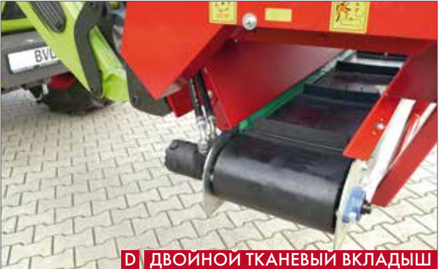
Д ДВОИНОЙ ТКАНЕВЫЙ ВКЛАДЫШ