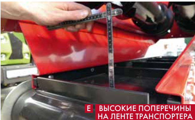
Е ВЫСОКИЕ ПОПЕРЕЧИНЫ НА ЛЕНТЕ ТРАНСПОРТЕРА