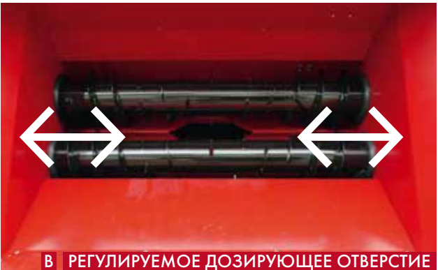
В РЕГУЛИРУЕМОЕ ДОЗИРУЮЩЕЕ ОТВЕРСТИЕ