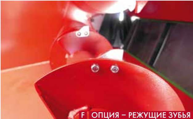
Ф ОПЦИЯ – РЕЖУЩИЕ ЗУБЬЯ

А РЕГУЛИРОВКА СКОРОСТИ ДОЗИРУЮЩИХ ШНЕКОВ Независимая корректировка скорости дозирующего шнека является удобным дополнением. Равномерное дозирование на разной дистанции разбрасывания обеспечивает оптимальную подготовку подстилки. В ДОЗИРУЮЩЕЕ ОТВЕРСТИЕ Дозирующее отверстие разбрасывателя подстилки может быть отрегулировано вручную под разные подстилочные материалы. Это позволяет оптимально адаптировать устройство к местным условиям. С ПРИВОД POWER CHAIN Цепное соединение двух дозирующих шнеков обеспечивает мощную синхронизацию и равномерную выгрузку материала. Д ДВОИНОЙ ТКАНЕВЫЙ ВКЛАДЫШ Наличие двойного тканевого вкладыша способствует стабильности и износостойкости ленты транспортера. Е ВЫСОКИЕ ПОПЕРЕЧИНЫ НА ЛЕНТЕ ТРАНСПОРТЕРА Благодаря высоким поперечинам на ленте транспортера можно быстро и легко распределять даже большие объемы подстилки. Ф РЕЖУЩИЕ ЗУБЬЯ КАК ОПЦИЯ Дополнительные режущие зубья позволяют разрыхлять нарезанные тюки.