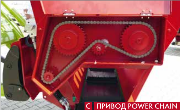
С ПРИВОД POWER CHAIN